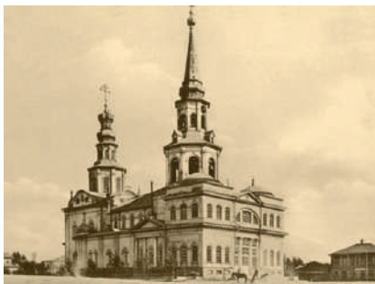
Илл. 1. Екатерининский собор до Революции.